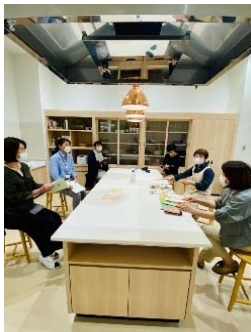
(朴葉寿司プロジェクト)